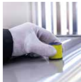
Abranet® Soft Weich und anschmiegsam