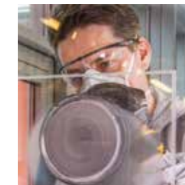
Abranet® SIC NS Siliziumkarbidkörnung