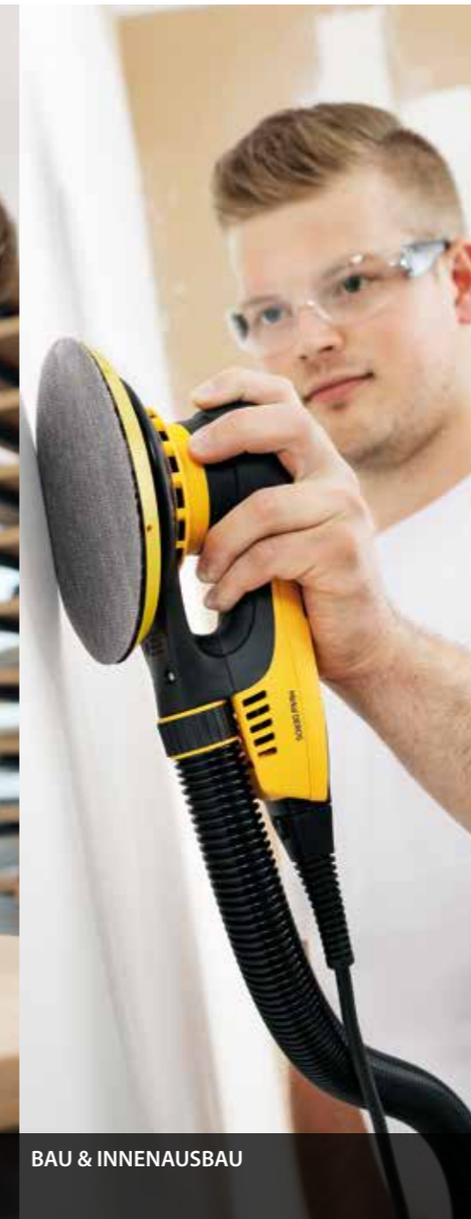
BAU & INNENAUSBAU