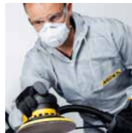
OSP Optimierter Schleifprozess