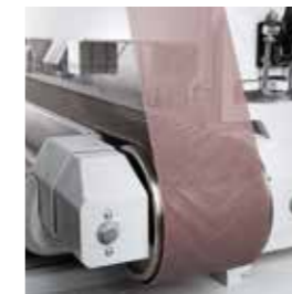
Abranet® Max Kühler Schliff