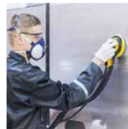
Abranet® NS Stearatfrei