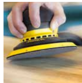
Abranet® Ace Keramische Körnung