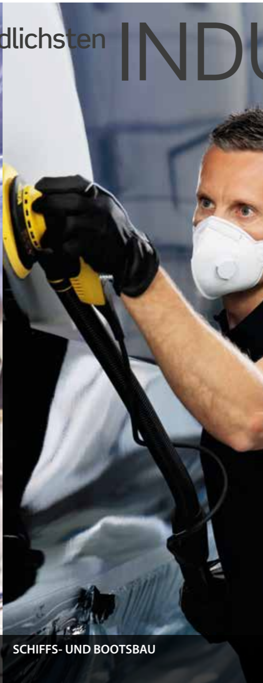
SCHIFFS- UND BOOTSBAU