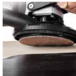
Abranet® Ace HD Abtragsrate