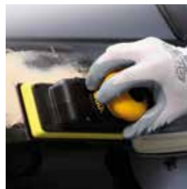
Abranet® Das Original-Netzschleifmittel

Mittlerweile ist die Produktfamilie um einige neue Mitglieder angewachsen. Und wir gehen davon aus, dass wir in naher Zukunft mit weiterem Zuwachs rechnen können.