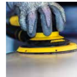
Abranet® NC Korrosionshemmend