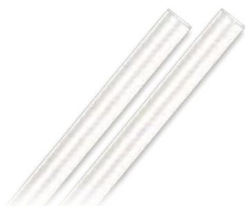
Weiß (ähnlich RAL 9016)