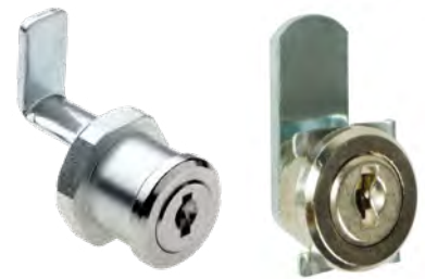
ZS 77 H