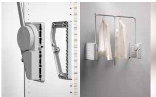
Distanz - 20 mm