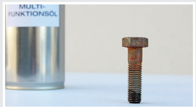
Kriechfähigkeit anderer Multifunktionsöle